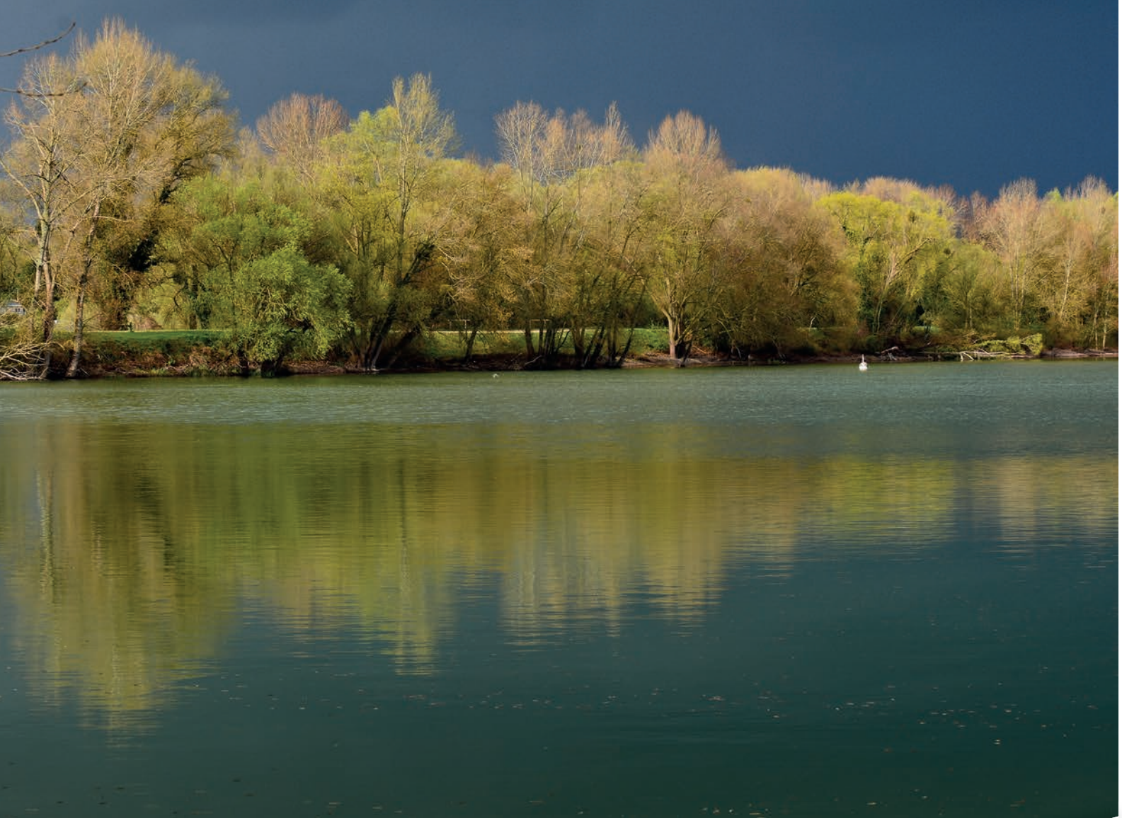
Photo gagnante du Concours Photo Instagram - avril 2021 - réalisée par Karine POUZET.